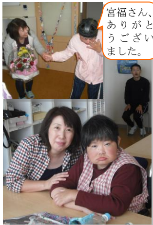
さんがとい宮福ありごま