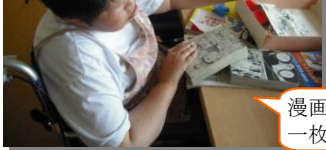
漫画を一枚一枚破いて