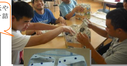
漫画の紙や新聞紙を詰め込んで