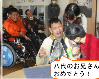
八代のお兄さんおめでとう!

今年の新年会は自由空間で行いました。一人一人新年の挨拶や抱負を語る事ができました。また、福笑いを各テーブルごとに行い、みんなで一つの作品を作り上げました。完成した福笑いは玄関ロビーに飾り、いつも3人の福の神!?!が笑顔で迎えてくれます。