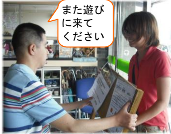
また遊びに来てください

東日本大震災に伴う津波により、いわきの海岸林は大きな被害を受けました。美しい景観と海岸林本来の機能を取り戻すために、たくさんのクロマツを植林していく必要があります。そこで、栃木県のNPO法人「トチギ環境未来基地」が、市民の力で苗木を育て、植林する『苗木forいわき』プロジェクトをスタート。自由空間も参加し、海岸林の再生に貢献していきます。先日、10本のクロマツの苗木が届けられ、なかまたちは、しっかりと水やりをして大きく育て、来年、海岸へ植林することを約束しました。