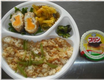
ツナご飯、あぶ玉子、漬物、かぼちゃサラダ、プリン