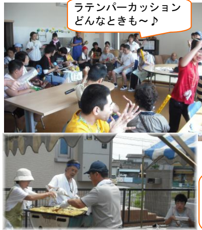
ラテンパーカッション どんなときも〜♪

灼熱の太陽の下、なつまつりが、自由空間で開催されました。自由空間は、手話の歌「未来へ」とラテンパーカッション「ヘビーローテーション」「どんなときも」を元氣良く発表しました。露店には、焼きそばにカレーライス、フランクフルト、冷やしきゅうり、ポップコーン、かき氷…と盛りだくさんのメニューが並び、なままたちのお腹は十分満たされたことでしょう。ご協力いただきましたました虹の会の皆様、ありがとうございます。